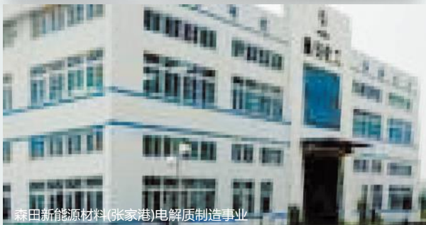
森田新能源材料(张家港)电解质制造事业