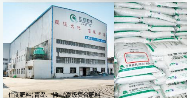
住商肥料(青岛、佛山)高级复合肥料