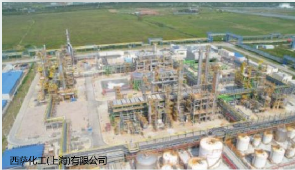
西萨化工(上海)有限公司