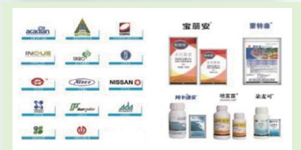
住商农资的合作伙伴