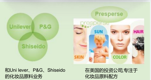
和Unilever、P&G、Shiseido的化妆品原料业务