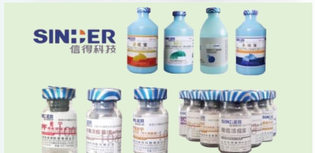
住友商事在中国投资的动物药企业 山东信得科技股份有限公司