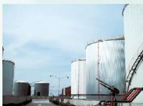
有机化学品的储罐库存销售进口，库 存，国内营销