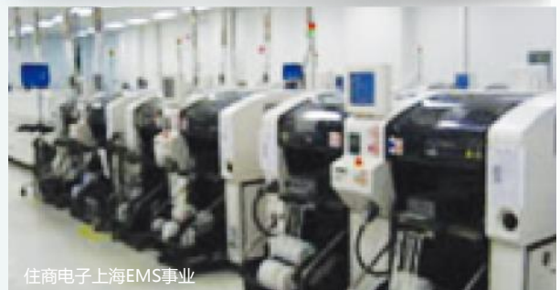
住商电子上海EMS事业