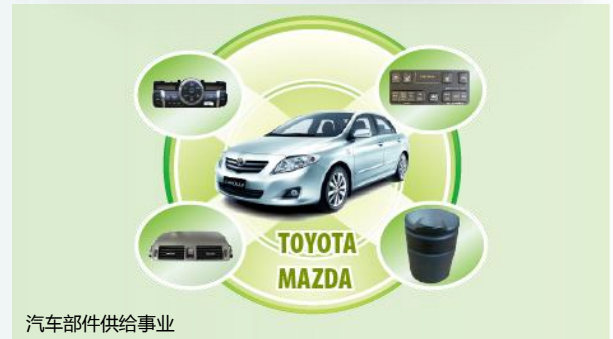
汽车部件供给事业