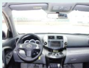
向汽车厂商供应内部零部件