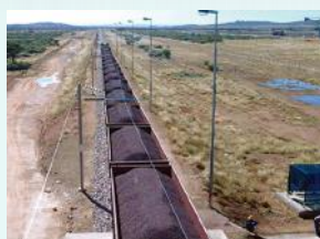
从铁矿石矿区通往装运港的铁路运输