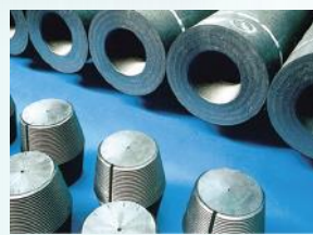
电弧炉炼钢使用的石墨电极