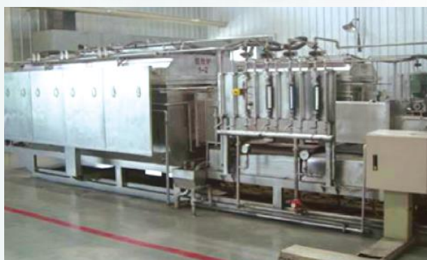
赣州江钨友泰新材料