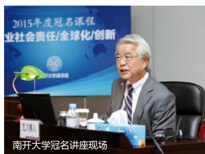
南开大学冠名讲座现场