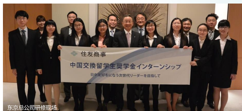
东京总公司研修现场

以中国四所大学派往日本大学的1年交换留学生为对象，资助留日期间生活费(每人10万日元/月)、往返机票，并安排其参加总公司的企业培训。