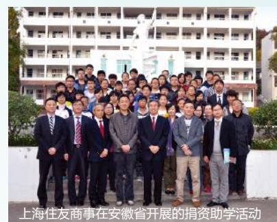
上海住友商事在安徽省开展的捐资助学活动