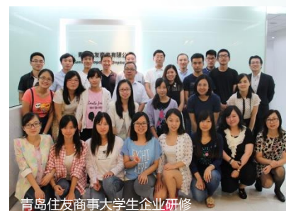
青岛住友商事大学生企业研修