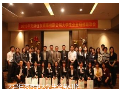
天津住友商事大学生企业研修